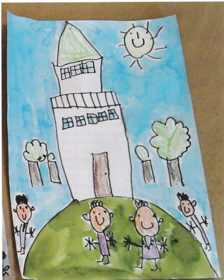
Vítězný obrázek: zámek Humprecht - Lucie Balcarová MŠ Sobotka