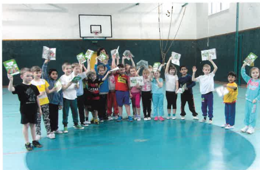
Česká televize: natáčení v ZŠ Sobotka