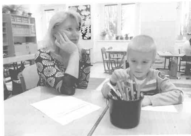
Zápis do 1. tříd