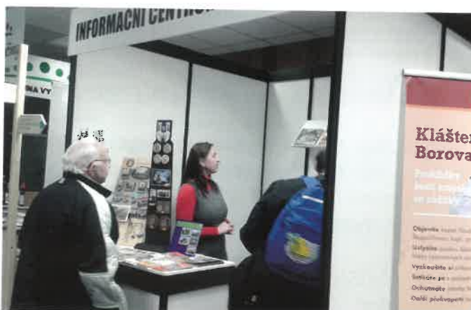
NOVÝ SOBOTECKÝ LETÁK