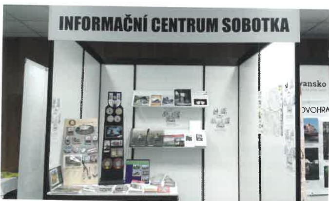
INFOTOUR a CYKLOTURISTIKA Hradec Králové