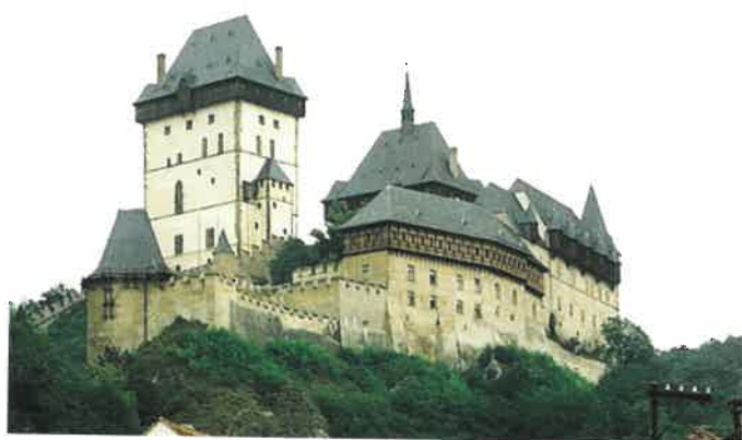
700. VÝROČÍ NAROZENÍ KARLA IV.